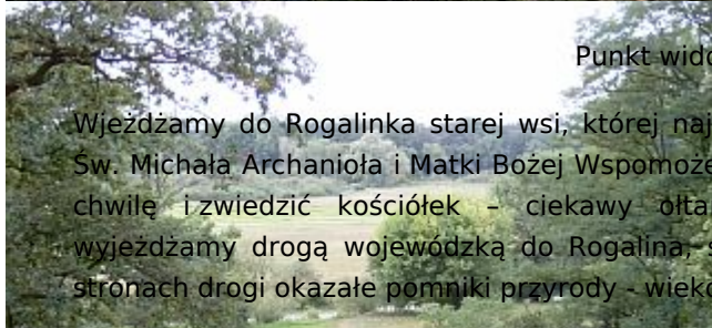
Punkt widokowy w Rogalinie

Trasa przez 7 km aż do Pałacu w Rogalinie prowadzi poboczem szosy. Przejeżdżamy przez most nad Wartą, z którego rozpościera się malowniczy widok na dolinę rzeki. Po lewej stronie droga prowadząca (ok. 2km) do Ośrodka Szkolenia Turystyki Węzłowego ZHP, po prawej stronie widać zabudowania Pałacu w Sowińcu (rezydencja prywatna) oraz turystyczną turbinę elektrowni wiatrowej.