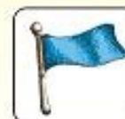
potrzeba pomocy medycznej